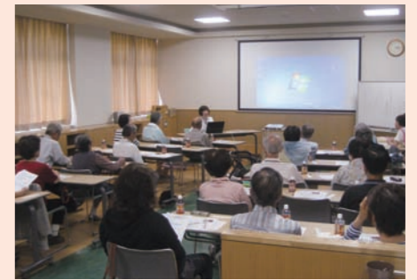
そらまめ教室の様子

当法人は、保存期腎不全、糖尿病腎症など腎臓病に対して総合的に取り組み、慢性腎臓病(CKD)の進展と透析導入への予防に努めています。