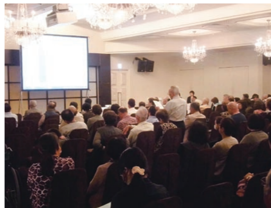
透析患者さんと職員の集い(P5)