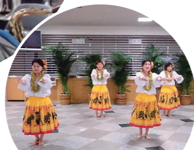
ふれあい高須まつり(P2~3)