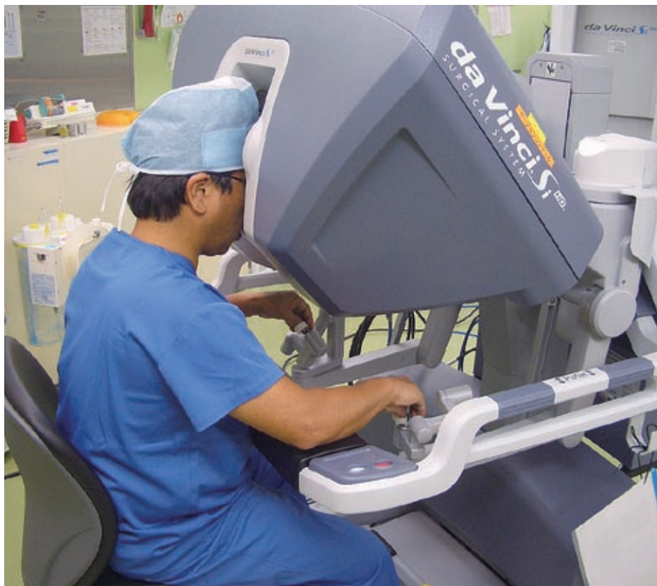
3次元カメラで視野が拡大、また操作性にも優れる。