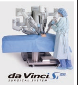
da Vinci Si SURGICAL SYSTEM

「ダビンチ」は3次元カメラ、ハサミ、鉗子(かんし)などを装着した手術支援ロボットです。従来の腹腔鏡下手術に比しても、出血量、痛み等が少ないなど、多くの利点を有しています。