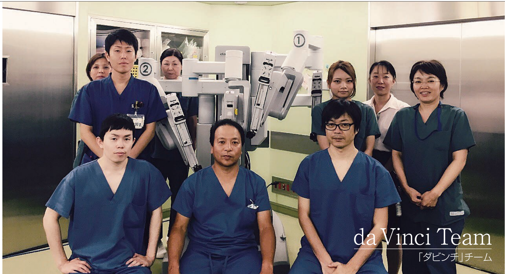
da Vinci Team 「ダビンチ」チーム

の利点は3次元カメラによる良好な拡大視野が得られることと、手術操作を行う鉗子(かんし)の操作性が非常に優れていることです。これにより、出血量の減少、手術時間の短縮、癌の根治性の向上、性功能や尿禁制などの機能温存の向上が可能となり、従来よりも良好で安全な医療の提供が期待されます。