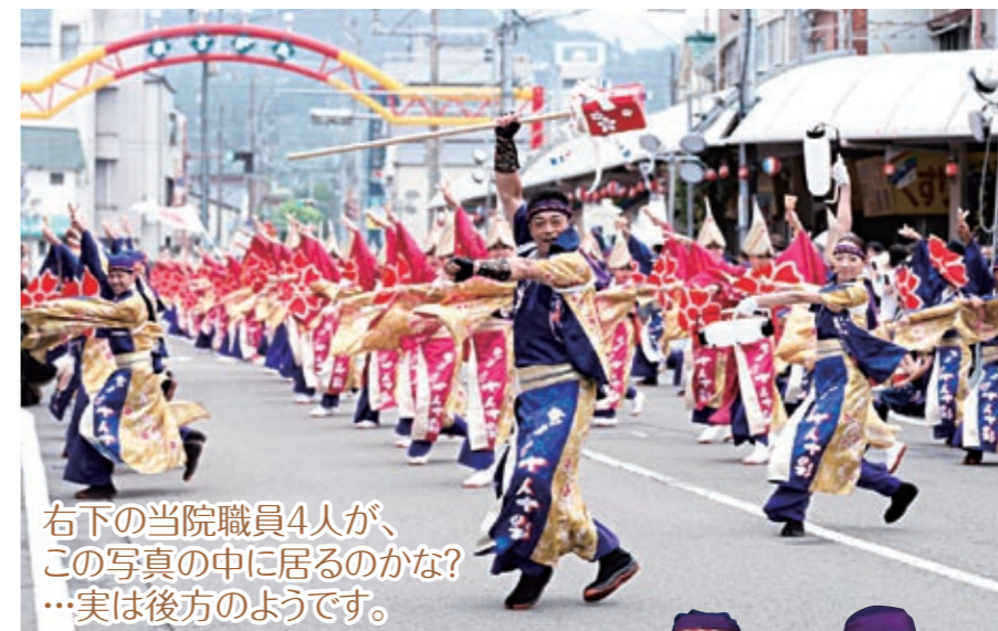
右下の当院職員4人が、この写真の中に居るのかな? ...実は後方のようなです。

練習は厳しく、特に隊列を揃える事を非常に重要視していました。その中で「ミリ単位で揃えて下さい!」という言葉がとても印象に残っており、私が今まで踊ってきたよさこいの概念にはない経験でした。