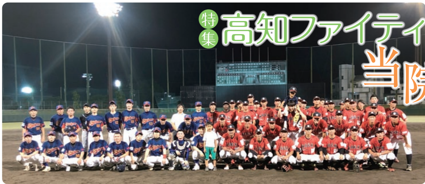
高知高須病院野球部《高須ダイアライザー》選手一覧